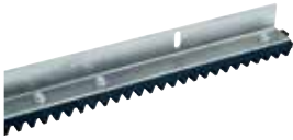
ACS9000 CREMALLERA M4 (sec. 25 x 22 mm) en Nylon con angular (hasta 1.000 Kg) en barras de 1 m al m ACS9001 Caja de 10 m