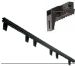
ACS9026 Cremallera de nylon M4 con barra interna de acero (sec. 28 x 40 mm). Con 6 conexiones hacia abajo (hasta 800 Kg). en barras de 1 m al m