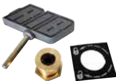
ACG8672 CERRADURA DE DESBLOQUEO CON LLAVE HEXAGONAL