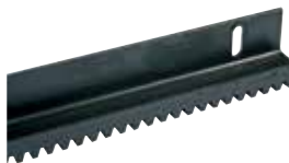
ACS9050 CREMALLERA M4 de acero (sec. 22 x 22 mm) tratada con CATAFORESIS, con angular 45 x 30 mm (hasta 4.000 Kg) en barras de 2 m al m