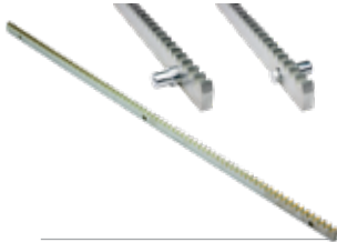
ACS9021 CREMALLERA M4 de acero (sec. 30 x 12 mm) (hasta 2.000 Kg) con trinquetes redondos en paquete de 4 barras de 1 m al m