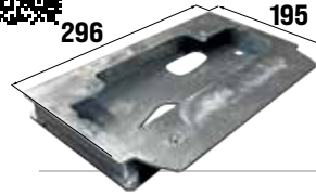
ACG8117 BASE DE ANCLAJE adaptador CAME BX para K500