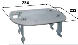
ACG8108 BASE DE ANCLAJE para K500 a ser enterrada