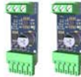
ACG8081 Schede di sincronizzazione dei comandi e delle sicurezze di 2 INDUSTRIAL Sincronizzazione attivabile solo con App RIB GATE