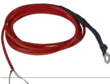
ACG4666 SONDA per riscaldamento motore (per partenze immediate con temperature rigide)