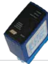
ACG9060 SENSORE A SPIRA MAGNETICA per apertura con automezzi monocanale - 230 Vac