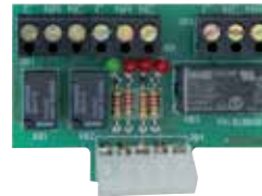
ACQ9081 SCHEDA 3 RELÉ per gestire una lampada di cortesia, un semaforo o un blocco elettromagnetico