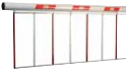
ACG8290B RASTRELLIERA L=2m L reale = 1,63m