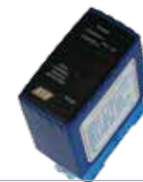
ACG9064 SENSORE A SPIRA MAGNETICA per apertura con automezzi bicanale - 12÷24 Vac/dc