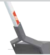
ACG8512 ASTA OTTAGONALE L=7,5m ÷ 12 m con taglio su misura