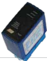
ACG9063 SENSORE A SPIRA MAGNETICA per apertura con automezzi monocanale - 12÷24 Vac/dc