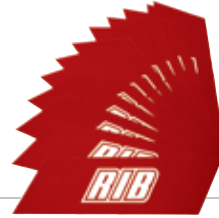
ACG8527 ADESIVI per asta ottagonale 12 pezzi