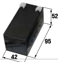
ACG9511 BATTERIA 1,2Ah 12V (ordinare 2 pezzi per ogni ACG5482)