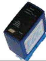
ACG9064 SENSORE A SPIRA MAGNETICA per apertura con automezzi bicanale - 12÷24 Vac/dc