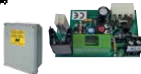
ACG5482 CARICA BATTERIE STOPPER (necessita di 2 pezzi di ACG9511) con contenitore