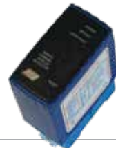
ACG9063 SENSORE A SPIRA MAGNETICA per apertura con automezzi monocanale - 12÷24 Vac/dc