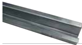
ACG5481 GUIDA CATENA da interrare L = 2 m