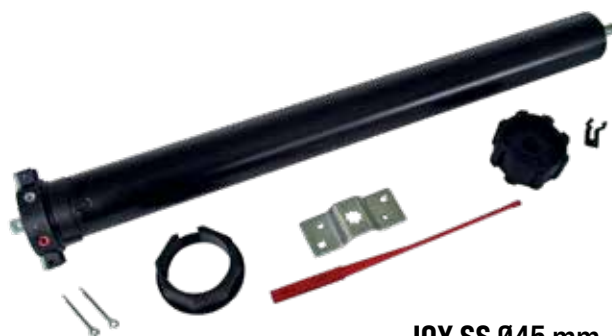
JOY SS Ø45 mm