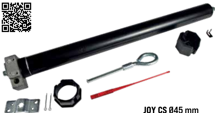
JOY CS Ø45 mm